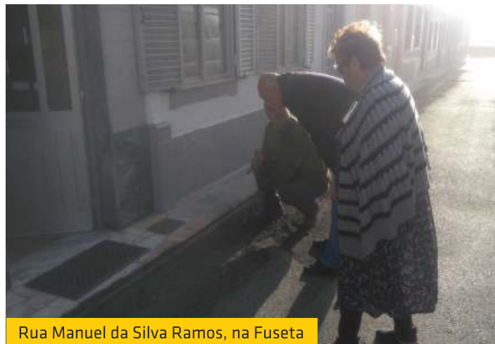
Rua Manuel da Silva Ramos, na Fuseta

Para tentar solucionar um problema existente há anos na Rua Manuel da Silva Ramos, na Fuseta, a União das Freguesias efetuou a fresagem de uma berma, visando a criação de um canal de escoamento de águas pluviais, que em dias de muita precipitação criava problemas aos habitantes desta artéria da Fuseta, originando grande acumulação de água que, em muitos casos, acabava por entrar para dentro das habitações.