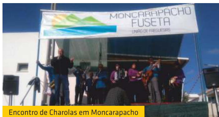
Encontro de Charolas em Moncarapacho

A 1.ª fase da competição termina no dia 18 de fevereiro, seguindo-se depois o play-off de apuramento de campeão, que assegura também a subida ao Campeonato Nacional da 2.ª divisão.