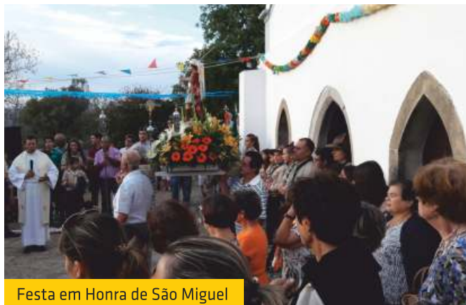
Festa em Honra de São Miguel

Nos anos anteriores a União das Freguesias de Moncarapacho e Fuseta já havia colaborado noutras obras efetuadas na conservação do edifício, que tem mais de 500 anos.