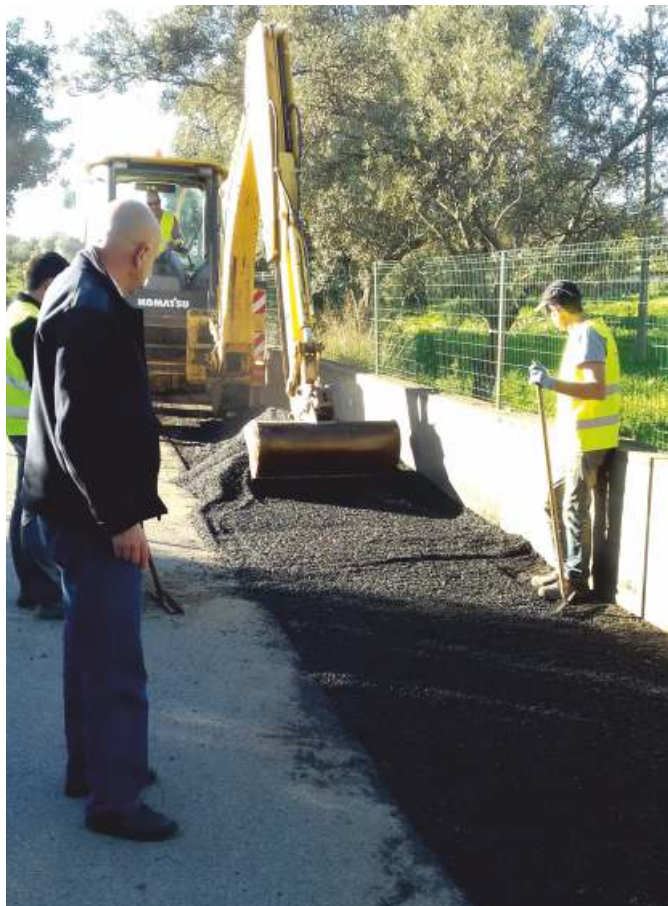
Colocação de alcatrão no Caminho das Olarias, em Moncarapacho

A União das Freguesias de Moncarapacho e Fuseta tem efetuado várias intervenções destinadas a melhorar o escoamento de águas pluviais em algumas estradas e caminhos da freguesia. Assim, e entre outras intervenções, foi efetuada a limpeza de uma linha de água/ponte no Lagoão; foi aberta uma nova valeta na berma da estrada Moncarapacho/Luz de Tavira, no sítio da «Caixinha de Fósforos», e procedemos também à limpeza das valetas de uma zona da Estrada Pereiro/Estiramantens e no Poço da Areia; e foi efetuada a fresagem de uma lomba na Estrada das Olarias. Nestas três últimas vias, a recorrente acumulação de águas pluviais no pavimento já colocava em causa a segurança rodoviária, pelo que a União das Freguesias entendeu ser necessário uma intervenção mais profunda e urgente.