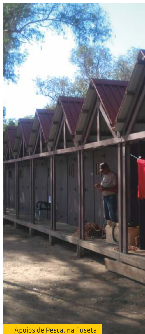
Apoios de Pesca, na Fuseta

Boletim Informativo da União das Freguesias de Moncarapacho e Fuseta N.º 6 Janeiro/Fevereiro/Março 2017