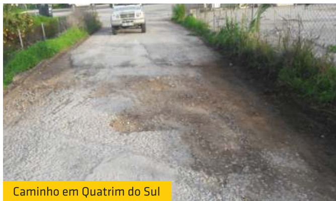
Caminho em Quatrim do Sul