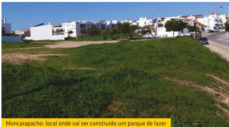
Moncarapacho: local onde vai ser construído um parque de lazer