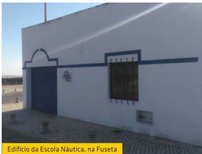
Edifício da Escola Náutica, na Fuseta

A 1.ª fase da competição termina no dia 25 de fevereiro, seguindo-se depois a 2.ª fase: os seis primeiros classificados irão discutir o título e a consequente subida ao Campeonato de Portugal.