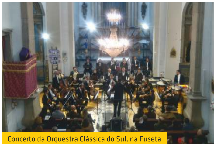
Concerto da Orquestra Clássica do Sul, na Fuseta

A União das Freguesias também tem efetuado diversas obras de restauro e manutenção dos passeios, nomeadamente de calçadas. Neste particular destacamos a intervenção que foi efetuada na calçada do passeio da Rua da Ponte Grande, na Fuseta.