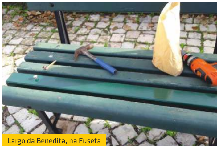
Largo da Benedita, na Fuseta

Devido à sua degradação, a União das Freguesias de Moncarapacho e Fuseta procedeu à reparação das madeiras dos bancos do Largo da Benedita (Cerro), na Fuseta.