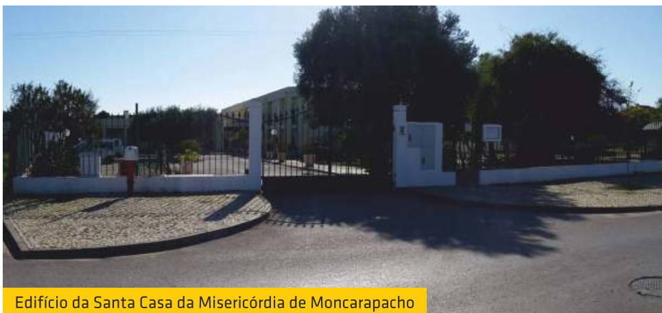
Edifício da Santa Casa da Misericórdia de Moncarapacho

- É ótimo. O nosso trabalho é reconhecido e sabem que só não fazemos mais porque não podemos. Também temos um bom relacionamento com o Sr. Presidente da União das Freguesias de Moncarapacho e Fuseta, que nos presta muita ajuda. Queremos ter mais “irmãos” e, de preferência, gente mais nova porque muitos elementos desta direção já têm idade mais avançada. Gostávamos por isso de ter mais juventude e que tragam novas ideias “revolucionárias”, como se costuma dizer.