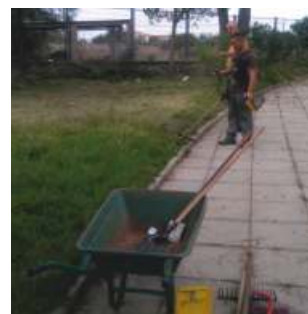
Escola Dr. João Lúcio, na Fuseta