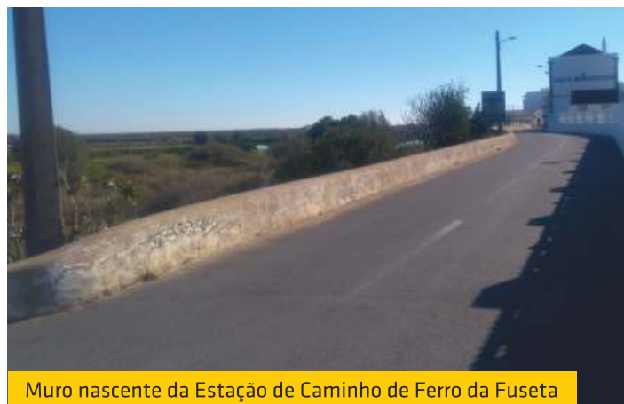
Muro nascente da Estação de Caminho de Ferro da Fuseta

Para tentar solucionar um problema existente há anos na Rua Manuel da Silva Ramos, na Fuseta, a União das Freguesias efetuou a fresagem de uma berma, visando a criação de um canal de escoamento de águas pluviais, que em dias de muita precipitação criava problemas aos habitantes desta artéria da Fuseta, originando grande acumulação de água que, em muitos casos, acabava por entrar para dentro das habitações.