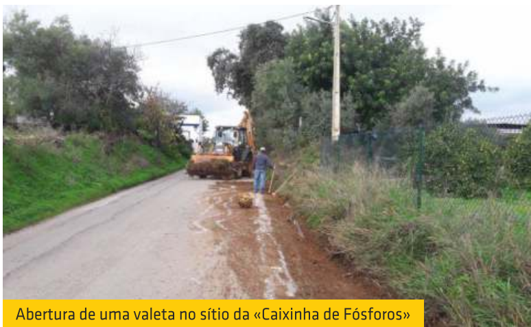
Abertura de uma valeta no sítio da «Caixinha de Fósforos»

A União das Freguesias de Moncarapacho e Fuseta tem efetuado várias intervenções destinadas a melhorar o escoamento de águas pluviais em algumas estradas e caminhos da freguesia. Assim, e entre outras intervenções, foi efetuada a limpeza de uma linha de água/ponte no Lagoão; foi aberta uma nova valeta na berma da estrada Moncarapacho/Luz de Tavira, no sítio da «Caixinha de Fósforos», e procedemos também à limpeza das valetas de uma zona da Estrada Pereiro/Estiramantens e no Poço da Areia; e foi efetuada a fresagem de uma lomba na Estrada das Olarias. Nestas três últimas vias, a recorrente acumulação de águas pluviais no pavimento já colocava em causa a segurança rodoviária, pelo que a União das Freguesias entendeu ser necessário uma intervenção mais profunda e urgente.