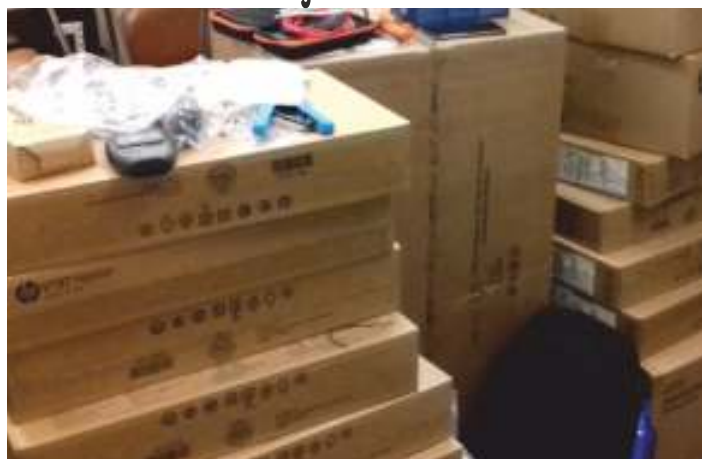
Material informático para a modernização administrativa da União de Freguesias

Já começou o processo de modernização administrativa da União de Freguesias de Moncarapacho e Fuseta. Esta intervenção renovará o sistema informático nos postos de atendimento em Moncarapacho e na Fuseta, na Biblioteca e no Parque de Campismo da Fuseta, e possibilitará a interação da população com a junta de freguesia, com a disponibilização de documentação e pedidos online.