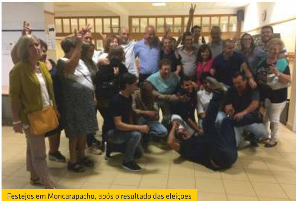
Festejos em Moncarapacho, após o resultado das eleições