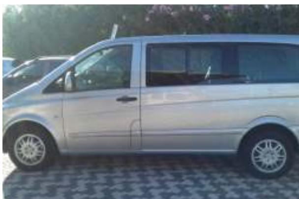
Viatura adquirida pelo Clube de Caça e Pesca Cavaquense

Uma das nossas finalidades é ajudar a dotar as coletividades da freguesia de condições adequadas para a prática das suas atividades, e nessa perspetiva a União de Freguesias de Moncarapacho e Fuseta tem estado sempre disponível para colaborar a resolver os seus problemas. Nesse sentido, apoiámos diversas coletividades, nomeadamente o Lusitano Ginásio Clube Moncarapachense, com a instalação de uma bancada amovível e a remodelação dos balneários do Estádio Dr. António João Eusébio; o Futebol Clube de Bias com a colocação de um relvado sintético no seu campo de jogos; e o Clube de Caça e Pesca Cavaquense, na aquisição de uma viatura para o transporte de atletas.