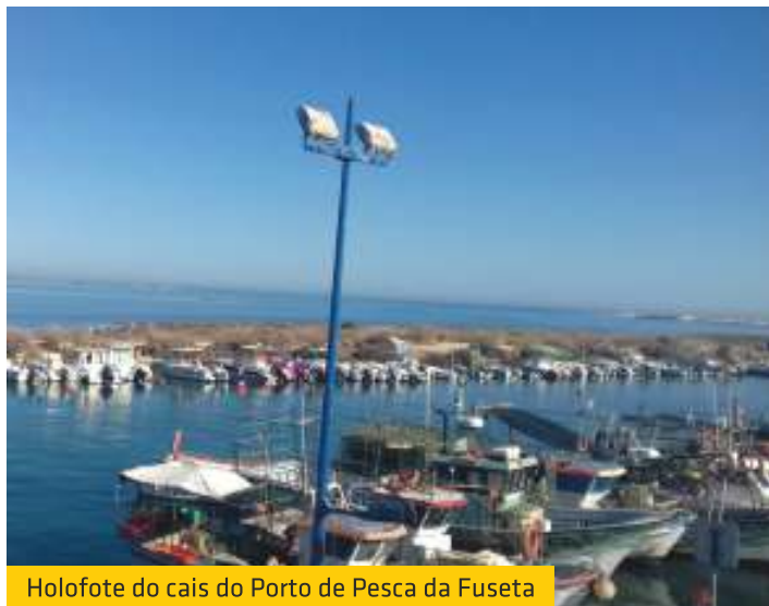
Holofote do cais do Porto de Pesca da Fuseta

Depois de alguns anos apagados, a União de Freguesias reparou e reativou os quatro holofotes do Porto de Pesca da Fuseta, melhorando assim as condições de trabalho noturnas dos pescadores.