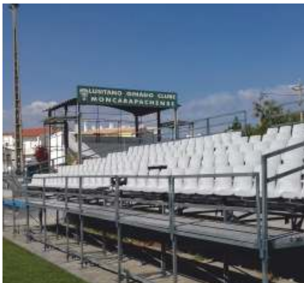
Bancada amovível colocada no Estádio Dr. António João Eusébio