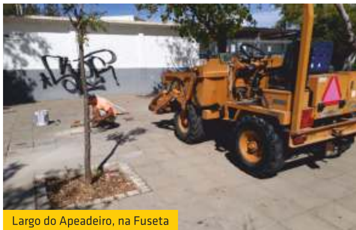
Largo do Apeadeiro, na Fuseta

Relembramos que continuam as obras de reparação do cais de desembarque de pesca, e brevemente terão início as outras fases da candidatura ao Programa Mar 2020, que inclui a colocação de 10 apoios de pesca para a comunidade piscatória e um carro de alagem para pequenas reparações, numa rampa.