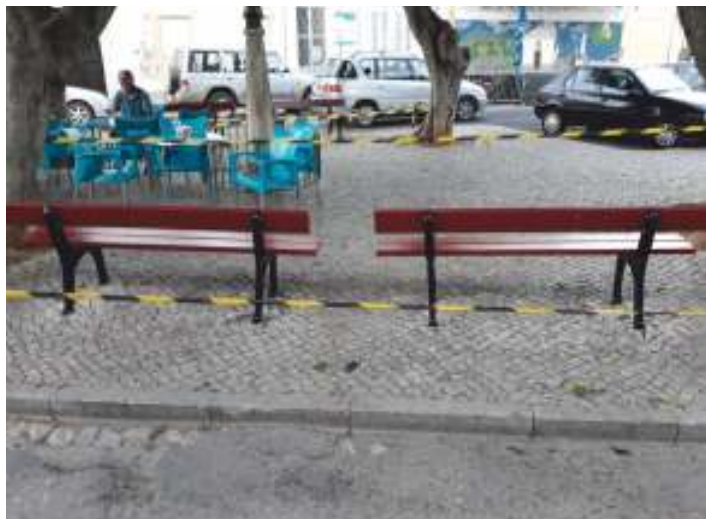
Bancos de jardim na Praça Major João X. de Castanheda, em Moncarapacho

Depois de ter colocado três bancos no Prolongamento da Avenida Maria Lizarda Palermo (Rua do lar de Idosos), em Moncarapacho, a União de Freguesias continuou a intervir na manutenção do mobiliário urbano, tendo reparado os bancos de jardim da Praça Major João Xavier de Castanheda e da Urbanização Os Varejões.