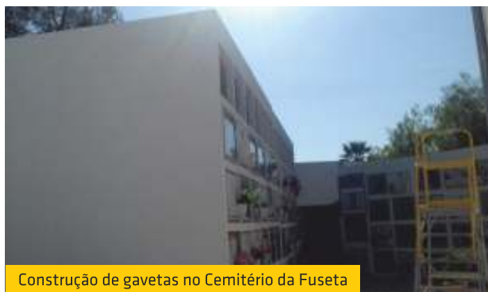
Construção de gavetas no Cemitério da Fuseta

Esta intervenção vai dotar a biblioteca de condições condignas aos seus inúmeros utentes, que diariamente frequentam o espaço, quer para leitura e estudo, como para a utilização dos computadores. Neste particular, brevemente procedermos a uma pequena remodelação no equipamento informático que estará à disposição dos utentes da biblioteca.