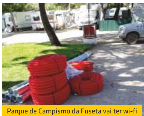
Parque de Campismo da Fuseta vai ter wi-fi