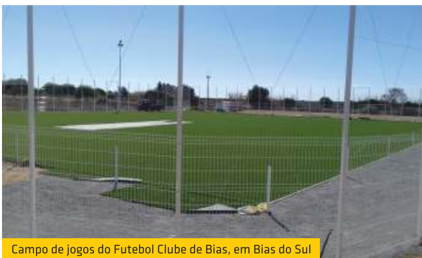
Campo de jogos do Futebol Clube de Bias, em Bias do Sul