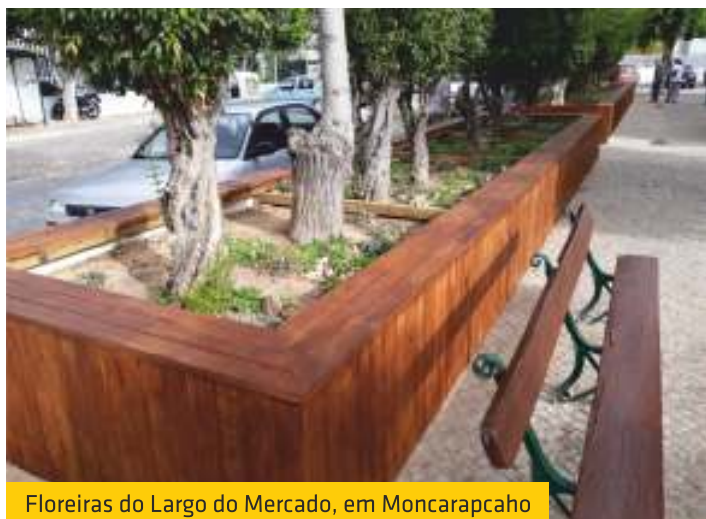
Floreiras do Largo do Mercado, em Moncarapacho

A União de Freguesias de Moncarapacho e Fuseta recuperou os dois blocos de floreiras contíguas ao Mercado de Moncarapacho, revestindo-as em madeira. Além do embelezamento do local, esta ação permitirá que a degradação dos seus muros não origine a sua destruição. Está prevista para breve uma ação idêntica no canteiro da Praça Major João Xavier de Castanheda.