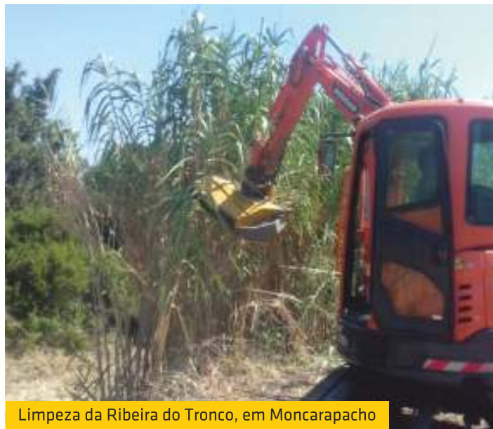
Limpeza da Ribeira do Tronco, em Moncarapacho

Em colaboração com os Viveiros Monterosa, a União de Freguesias de Moncarapacho e Fuseta limpou o canal da Ribeira do Tronco, numa zona compreendida entre o Parque de Merendas e a ponte de acesso ao antigo caminho romano.