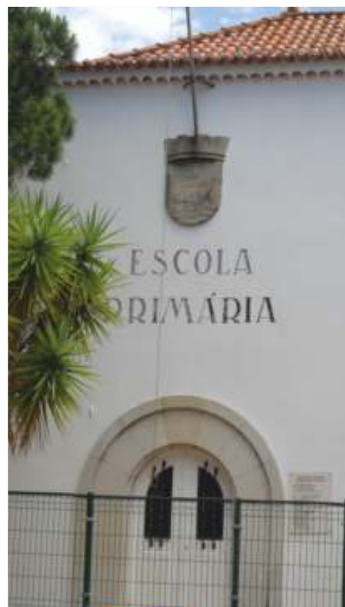
Entrada da Escola Primária, em Moncarapacho