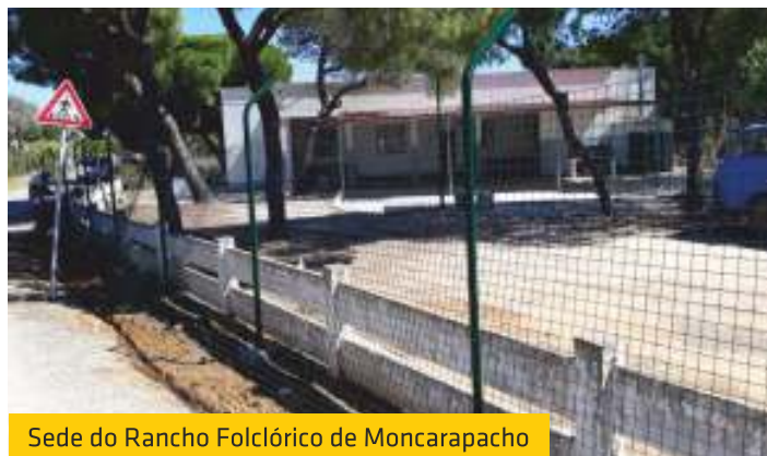
Sede do Rancho Folclórico de Moncarapacho

É possível efetuar a mudança de local de voto na União de Freguesias de Moncarapacho e Fuseta. Tal como já havíamos informado no número 2 do nosso Boletim Informativo, editado em janeiro de 2016, com a agregação das freguesias de Moncarapacho e da Fuseta, passaram a existir dois locais de voto na freguesia: o posto A (em Moncarapacho) e o posto B (na Fuseta), podendo os eleitores optar por votar no local mais próximo da sua residência. Para tal têm que manifestar essa intenção nos balcões de atendimento da União de Freguesias.