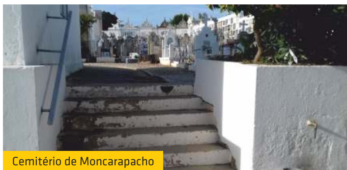
Cemitério de Moncarapacho

A União das Freguesias de Moncarapacho e Fuseta procedeu a diversos trabalhos de melhorias e reparações nos cemitérios de Moncarapacho e da Fuseta, dos quais destacamos: em Moncarapacho, foram colocados dois corrimões em dois locais com escadas e na Fuseta foi colocada calçada num local em terra.