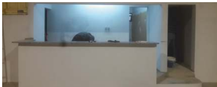
Construção de um bar e de instalações sanitárias no Pavilhão de Eventos em Moncarapacho

Com o intuito de dotar as instalações com condições mais adequadas para os diversos eventos que acolhe, a União das Freguesias de Moncarapacho e Fuseta procedeu à construção de um bar no interior do Pavilhão de Eventos, em Moncarapacho.