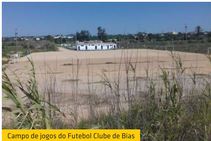
Campo de jogos do Futebol Clube de Biais

O Futebol Clube de Biais foi o único clube algarvio contemplado com verbas da venda da antiga sede da Federação Portuguesa de Futebol, recebendo 60 mil euros para a colocação de um relvado sintético e arranjos dos balneários no seu campo de jogos, situado em Biais do Sul.