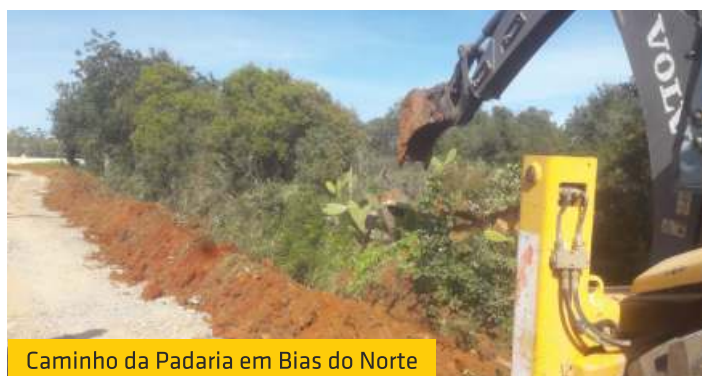
Caminho da Padaria em Bias do Norte

Esta obra é de grande importância para os moradores do referido local, satisfazendo assim uma pretensão de há muitos anos.