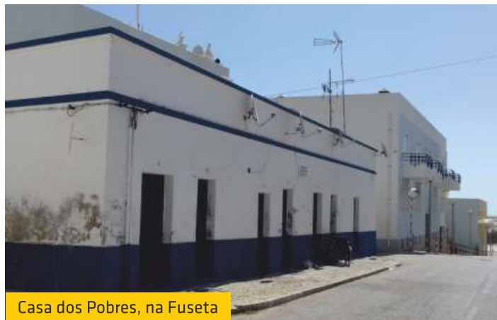
Casa dos Pobres, na Fuseta

O sucesso da parceria estabelecida no final do ano passado entre a União das Freguesias de Moncarapacho e Fuseta e o Estabelecimento Prisional de Olhão, levou a que as duas entidades voltem a cooperar. Nesse âmbito estão previstas várias pinturas a serem executadas na Fuseta, por uma brigada dereclusos do referido estabelecimento prisional, nomeadamente nos seguintes locais: «casa dos pobres», muros interiores e exteriores do polidesportivo e muros envolventes à Igreja Nossa Senhora do Carmo.