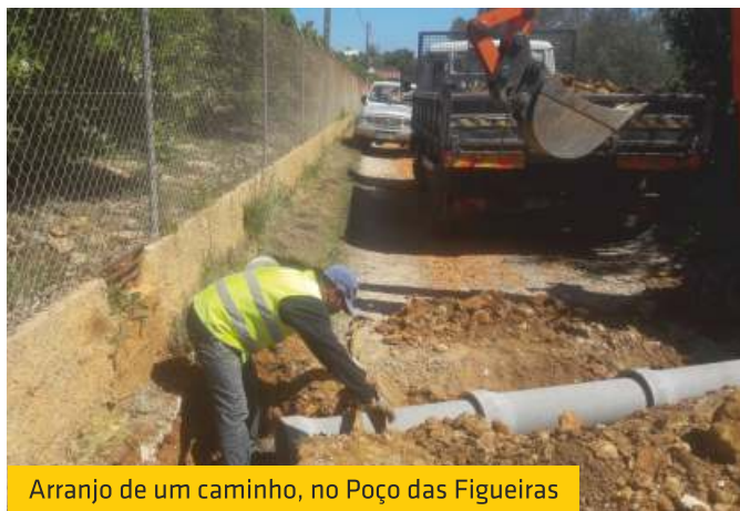
Arranjo de um caminho, no Poço das Figueiras