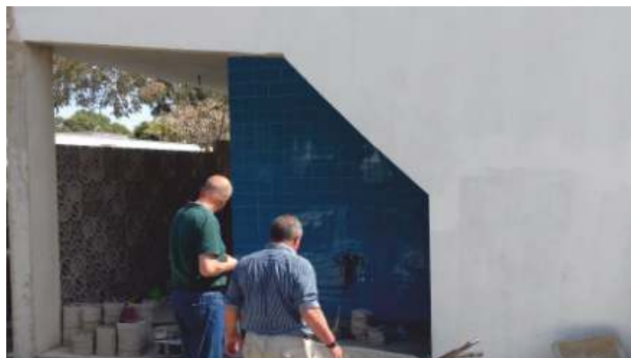
Construção do novo balneário do Parque de Campismo da Fuseta

O sucesso da parceria estabelecida no final do ano passado entre a União das Freguesias de Moncarapacho e Fuseta e o Estabelecimento Prisional de Olhão, levou a que as duas entidades voltem a cooperar. Nesse âmbito estão previstas várias pinturas a serem executadas na Fuseta, por uma brigada dereclusos do referido estabelecimento prisional, nomeadamente nos seguintes locais: «casa dos pobres», muros interiores e exteriores do polidesportivo e muros envolventes à Igreja Nossa Senhora do Carmo.