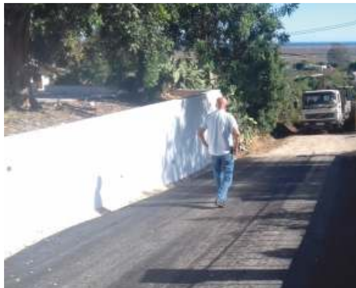
Colocação de alcatrão à entrada de um caminho em Quatrim do Sul

Para resolver uma situação de danificação provocada pelas águas pluviais na entrada de um caminho em Quatrim do Sul, a União de Freguesias de Moncarapacho e Fuseta colocou cerca de 350 m 2 de alcatrão.