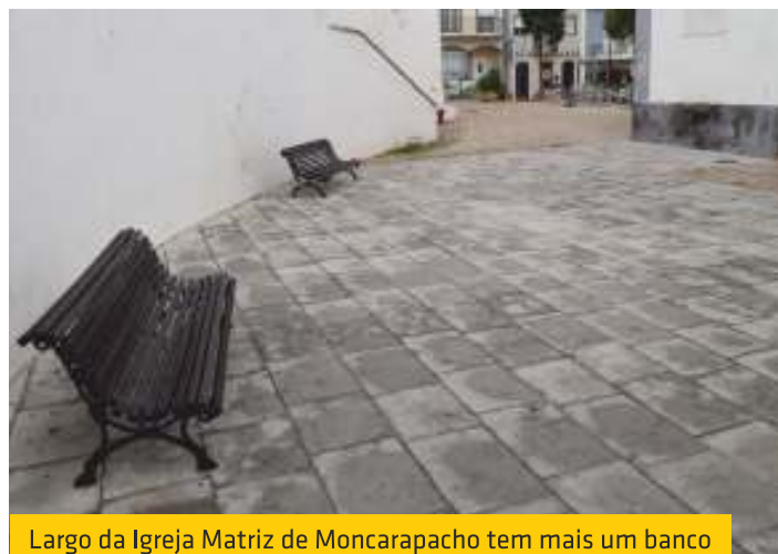
Largo da Igreja Matriz de Moncarapacho tem mais um banco

Dando continuidade ao trabalho que temos efetuado nos últimos tempos referente à requalificação e recuperação do mobiliário urbano da freguesia, colocamos dois novos bancos de jardim em Moncarapacho: um no Largo da Igreja Matriz e outro no Largo da Praça, junto às floreiras que foram recuperadas recentemente pela União de Freguesias de Moncarapacho e Fuseta.