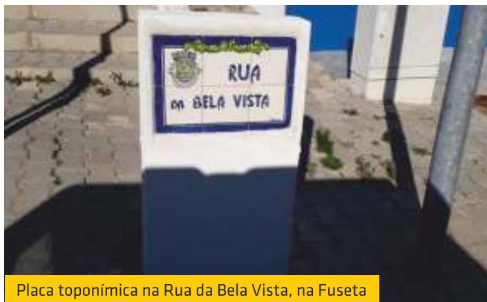
Placa toponímica na Rua da Bela Vista, na Fuseta

Depois de serviços de pintura efetuados em abril nas casas da Rua General Humberto Delgado, a União de Freguesias resolveu um problema que se arrastava há mais de dois anos, mandando recuperar uma habitação na Rua da Ponte Grande, para alojar um agregado familiar constituído por duas pessoas.