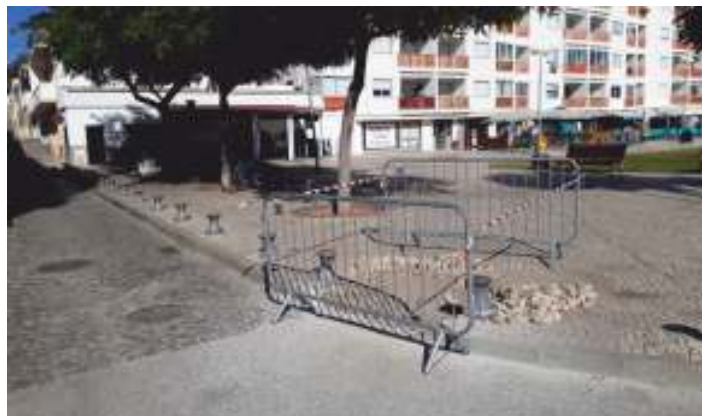
Abertura de uma rampa para pessoas com mobilidade reduzida

O Executivo da União de Freguesias de Moncarapacho e Fuseta está a dotar a freguesia de condições adequadas às pessoas com mobilidade reduzida, e nesse sentido procedeu à abertura de duas rampas na Fuseta: uma na Rua Francisco Emílio Batista, no Bairro dos Passarinhos (junto ao Centro de Saúde), e outra na Rua 25 de Abril, na Zona Ribeirinha.