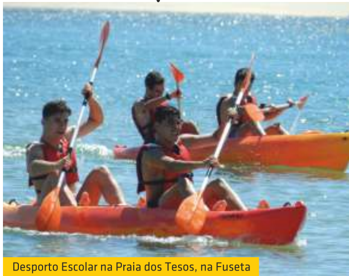
Desporto Escolar na Praia dos Tesos, na Fuseta

A União de Freguesias de Moncarapacho e Fuseta estabeleceu um protocolo com o Centro de Formação Desportiva do Agrupamento de Escolas Dr. Francisco Fernandes Lopes, para o desenvolvimento da prática de atividades desportivas náuticas, na Fuseta. O acordo prevê a cedência das instalações da Escola Náutica, assim como o respetivo equipamento e apoio logístico, e irá abranger os alunos das escolas do referido agrupamento, situadas em Olhão, Moncarapacho e Fuseta.