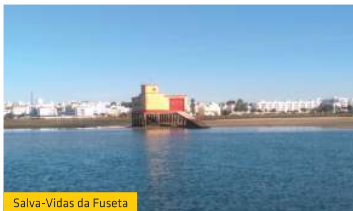
Salva-Vidas da Fuseta

Estas intervenções continuarão a ser efetuadas na freguesia, sempre que tal seja necessário para benefício da população.