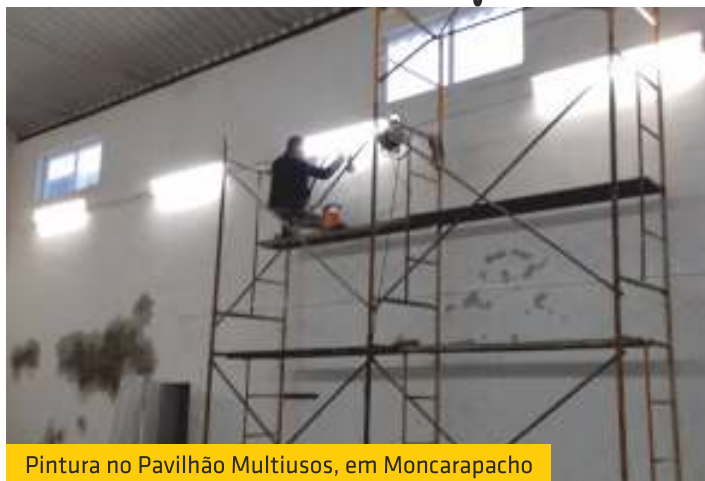
Pintura no Pavilhão Multiusos, em Moncarapacho

Depois de ter efetuado a pintura do Pavilhão de Eventos, agora foi a vez do Pavilhão Multiusos ser alvo de intervenção, com a reparação e pintura do seu interior. Tal como o Pavilhão de Eventos, este espaço de excelência para a freguesia também é propriedade da União de Freguesias, e é utilizado como ginásio, recebendo ainda as aulas de ginástica, de dança e de artes marciais que disponibilizamos à nossa população.