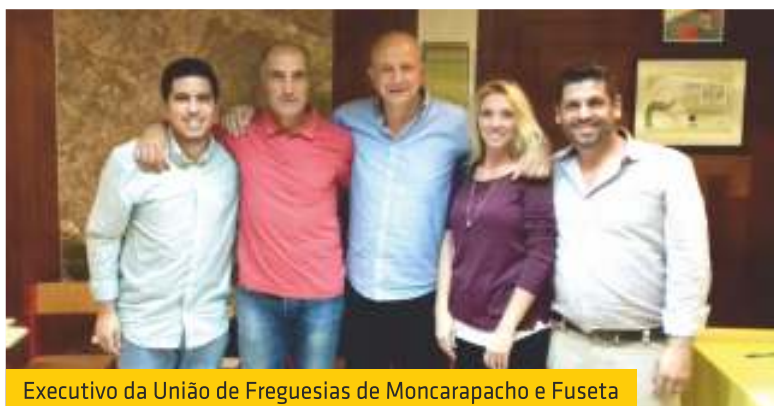
Executivo da União de Freguesias de Moncarapacho e Fuseta