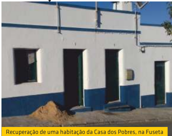
Recuperação de uma habitação da Casa dos Pobres, na Fuseta

Sempre atenta aos problemas de cariz social, a União de Freguesias de Moncarapacho e Fuseta tem efetuado regularmente obras e serviços de manutenção nas denominadas «Casas dos Pobres», situadas na Fuseta.