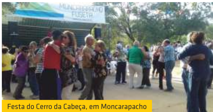
Festa do Cerro da Cabeça, em Moncarapacho