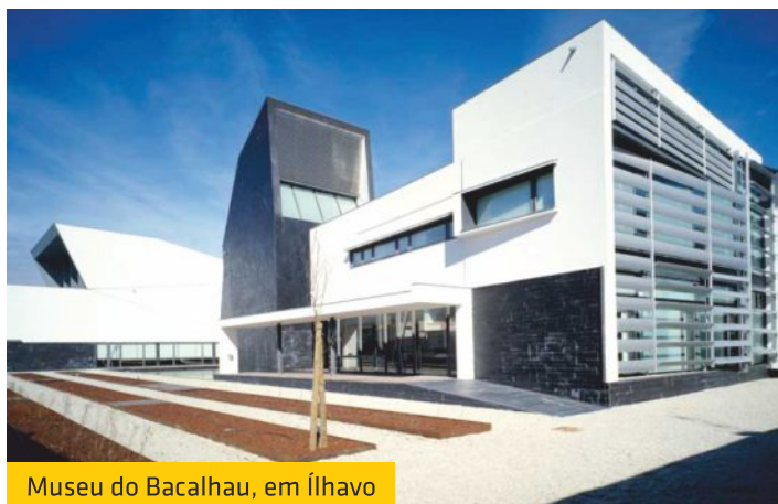
Museu do Bacalhau, em Ílhavo