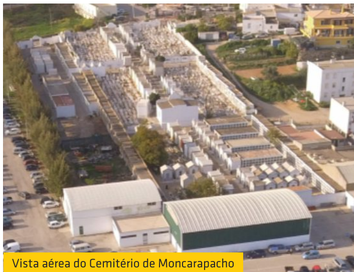
Vista aérea do Cemitério de Moncarapacho

A União de Freguesias de Moncarapacho e Fuseta está a implementar uma nova base de dados para o Cemitério de Moncarapacho. Assim, solicitamos aos proprietários de jazigos, campas e gavetas no referido cemitério, que se dirijam durante o horário de expediente ao Balcão de Atendimento da União de Freguesias, em Moncarapacho, para regularização de dados relativos à aquisição dos mesmos, devendo levar documento de identificação e documentação referente à sua aquisição.