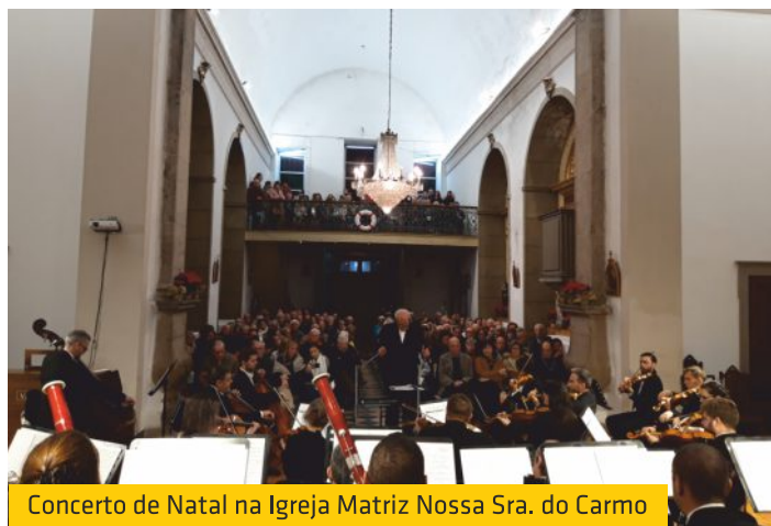
Concerto de Natal na Igreja Matriz Nossa Sra. do Carmo

Grande concerto de Natal que a Orquestra Clássica do Sul deu no dia 23 de dezembro, na Fuseta. A Igreja Matriz Nossa Senhora do Carmo esteve repleta de um público que ficou maravilhado com as músicas alusivas à época natalícia.