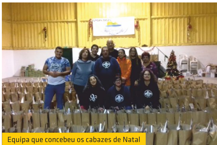
Equipa que concebeu os cabazes de Natal

Assim que a base de dados do Cemitério de Moncarapacho estiver concluída, o mesmo processo será efetuado no Cemitério da Fuseta.