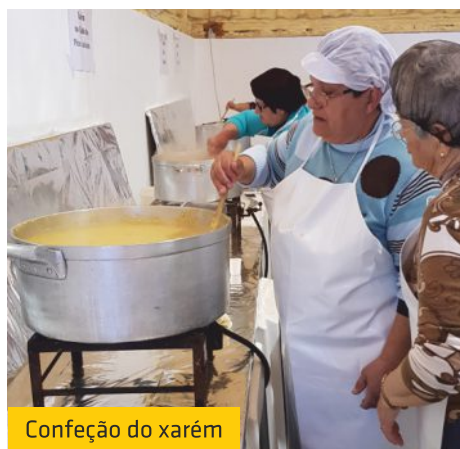
Confeção do xarém

Na manhã do dia 1 de janeiro, cerca de cinquenta «corajosos» tomaram o primeiro banho do Ano Novo na Praia dos Tesos, na Fuseta. Esta recente iniciativa tem contado de ano para ano com cada vez mais banhistas. Este ano a União de Freguesias de Moncarapacho e Fuseta associou-se e com a colaboração do Bar Borda d'Água ofereceu um chocolate quente aos que se atreveram a mergulhar.