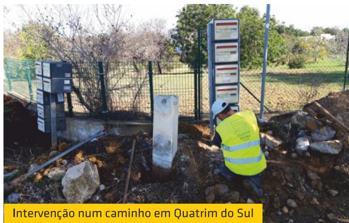
Intervenção num caminho em Quatrim do Sul

Na nossa missão de zelar pelo bom estado de conservação dos caminhos e vias rodoviárias da nossa freguesia, procedemos ao alargamento de um caminho em Quatrim do Sul e que dá acesso à Unidade de Desabituação do Algarve. A entrada do caminho também foi requalificada, tendo sido recolocado um marco geodésico, as caixas de correio e um sinal de trânsito, para permitir na referida via a circulação de veículos de maiores dimensões.