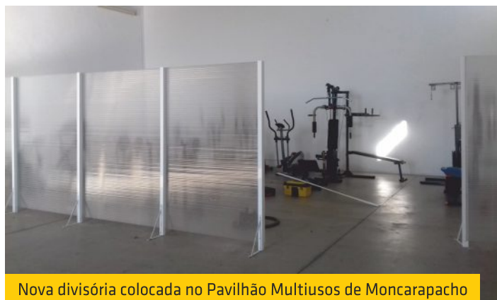
Nova divisória colocada no Pavilhão Multiusos de Moncarapacho

Na nossa missão de zelar pelo bom estado de conservação dos caminhos e vias rodoviárias da nossa freguesia, procedemos ao alargamento de um caminho em Quatrim do Sul e que dá acesso à Unidade de Desabituação do Algarve. A entrada do caminho também foi requalificada, tendo sido recolocado um marco geodésico, as caixas de correio e um sinal de trânsito, para permitir na referida via a circulação de veículos de maiores dimensões.