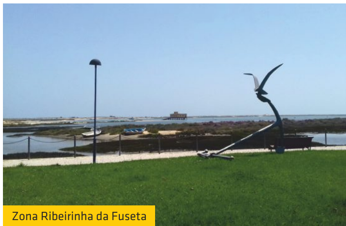
Zona Ribeirinha da Fuseta