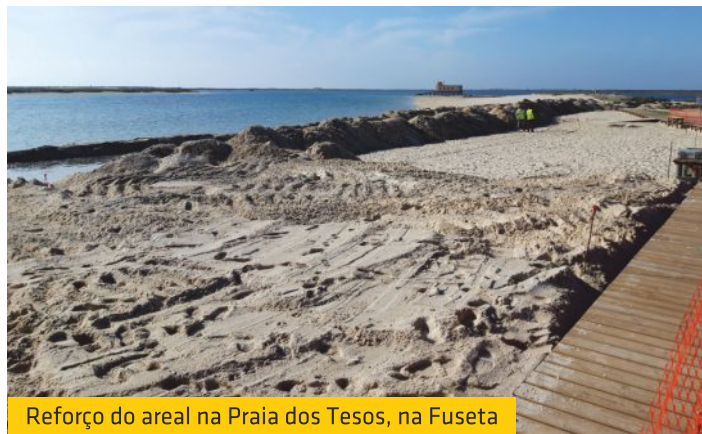
Reforço do areal na Praia dos Tesos, na Fuseta

Com o apoio da União de Freguesias de Moncarapacho e Fuseta a Polis Litoral Ria Formosa efetuou o reforço do areal da Praia Fuseta/Ria (Praia dos Tesos), na Fuseta.